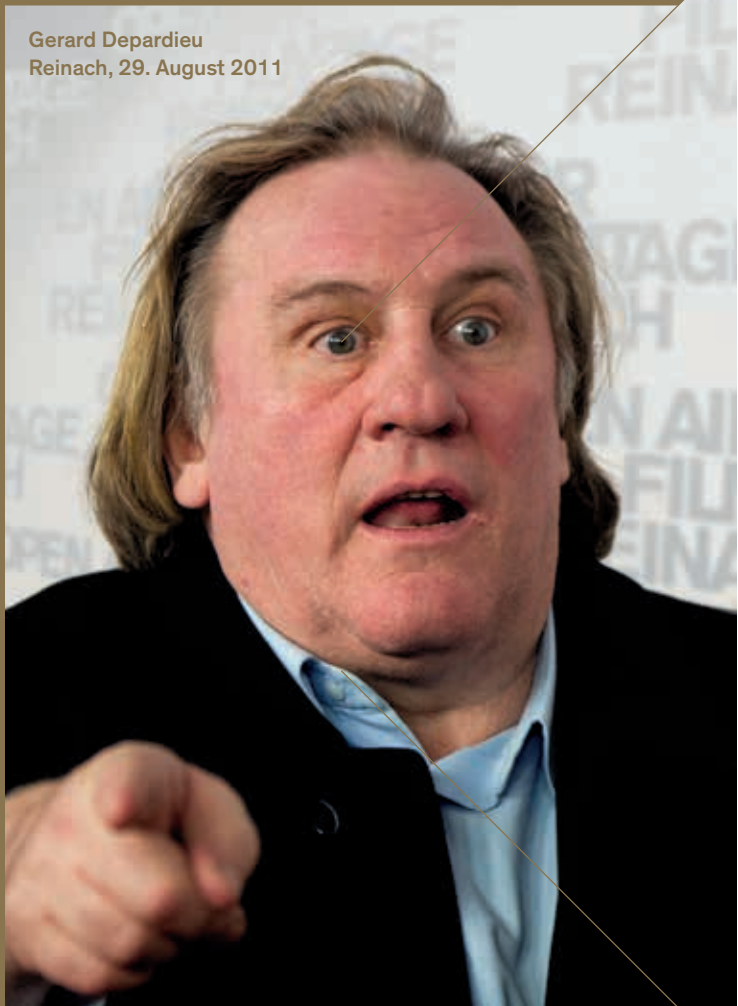
Gerard Depardieu Reinach, 29. August 2011