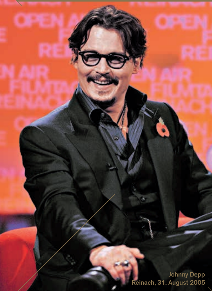
Johnny Depp Reinach, 31. August 2005