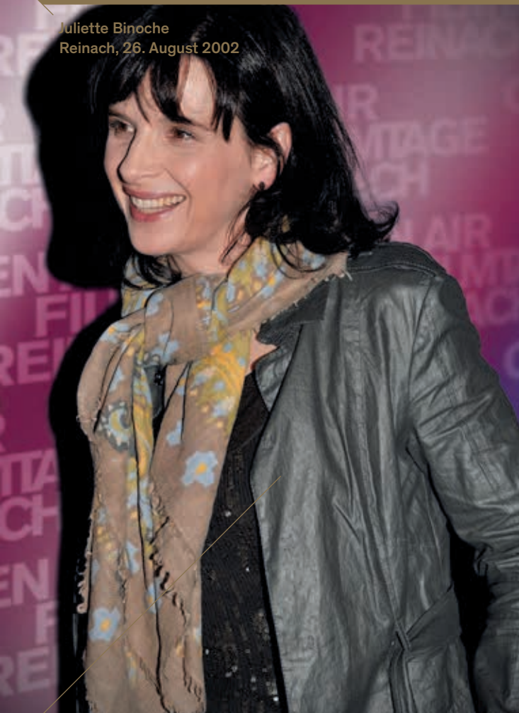
Juliette Binoche Reinach, 26. August 2002